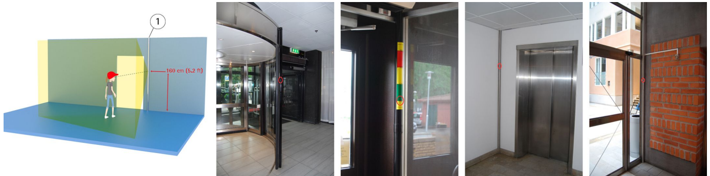
Von links nach rechts: Erfassungsbereich der AXIS P8514 Kamera (1) und Installationsbeispiele mit einer Kamerapositionierung auf 160 cm Höhe (rot eingekreist)

Kamera wird das Risiko mutwilliger Zerstörung minimiert. Dank der Röhrenform kann durch einfaches Drehen der Röhre die Blickrichtung der Kamera problemlos angepasst werden. Die AXIS P8514 unterstützt Power over Ethernet und verfügt über ein vormontiertes, 1,3 m langes Ethernetkabel mit Buchse.