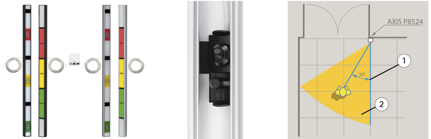
Links: die AXIS P8524 in Schwarz bzw. Silber und in angloamerikanischer bzw. metrischer Version. Mitte: Sensoreinheit im Gehäuse mit anpassbarem Schwenkwinkel von \pm 30^\circ zum Einstellen der gewünschten Blickrichtung. Rechts: Grafik einer Installation der AXIS P8524 im Türbereich mit einem Schwenkwinkel von 30^\circ (blaue Linien, Beschriftung 1), der das Sichtfeld von 57^\circ (gelbe Linien, Beschriftung 2) ermöglicht.

Das Gehäuse mit der Höhenmarkierung ist für die Installation an Ausgängen gedacht. Die Haupteinheit kann an einem unauffälligen Ort positioniert werden. Die Blickrichtung der Sensoreinheit kann angepasst werden. Die AXIS P8524 unterstützt Power over Ethernet und Gleichstromversorgung.