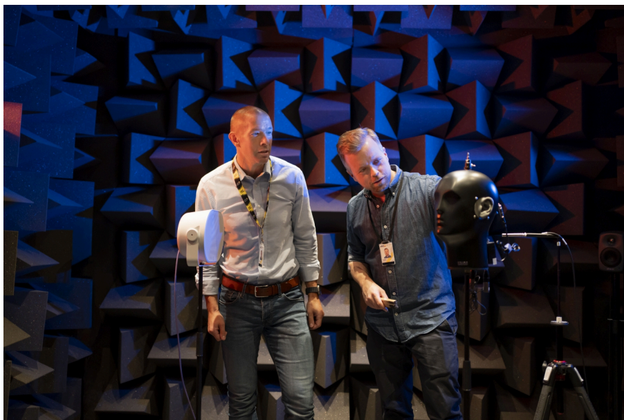
Mediciones acústicas en los laboratorios de I+D de Axis

rendimiento óptimo. Gracias a la combinación de herramientas líderes en el sector con nuestras propias metodologías a medida, somos capaces de optimizar el rendimiento e impulsar la innovación.