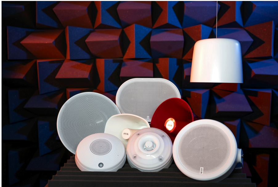
Altavoces Axis en nuestros laboratorios de I+D.

Con un diseño validado y reproducible establecido, utilizamos el procesamiento digital de señales para liberar todo el potencial de nuestra creación.