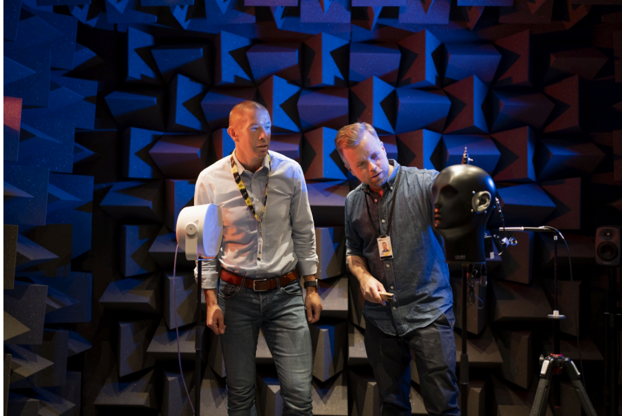
Axis R&D 실험실의 음향 측정

Axis의 최첨단 R&D 실험실에서는 패널, 메쉬, 웨이브가이드와 같은 핵심 부품을 최적화하기 위해 음향 측정을 활용하여 성능을 세밀하게 조정합니다. 업계 최고 수준의 도구와 자체 개발한 맞춤형 방법론을 결합함으로써, Axis는 성능을 최적화하고 혁신을 주도할 수 있습니다.