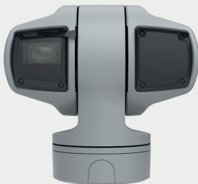
Axis Telecamere PTZ

Le telecamere PTZ offrono il monitoraggio in tempo reale di vaste aree grazie alle funzionalità Pan/Tilt/Zoom. La serie AXIS Q61 garantisce la massima fedeltà di riproduzione della scena e una perfetta qualità d'immagine in qualsiasi direzione, sopra e sotto l'orizzonte. Per questo, le telecamere di questa serie sono adatte a terreni lievemente scoscesi. La serie AXIS Q62 comprende telecamere che resistono a tutte le condizioni atmosferiche. La serie AXIS Q63 offre uno zoom veloce e la messa a fuoco laser, anche al buio. Grazie alla funzionalità Speed Dry, le immagini sono chiare e nitide anche in caso di pioggia.