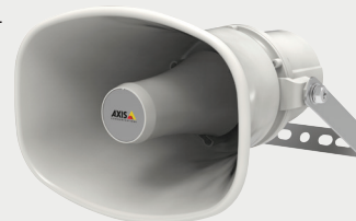
Axis Altoparlanti a tromba

Gli altoparlanti a tromba Axis consentono di dissuadere i malintenzionati ripresi dalle telecamere. Ad esempio, possono essere utilizzati per scoraggiare la presenza o le attività di persone indesiderate lungo il perimetro di un sito o dare istruzioni vocali in caso di emergenza o infrazioni di parcheggio.