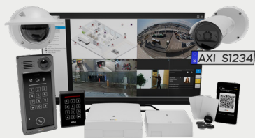
Axis Controllo accessi

Axis fornisce l'hardware e le analitiche per identificare, autenticare e autorizzare l'ingresso a edifici e stanze. La nostra tecnologia di controllo accessi protegge le aree critiche o vulnerabili con l'autenticazione automatica (badge, codici PIN, codici QR) o manuale (video e audio di rete bidirezionale).