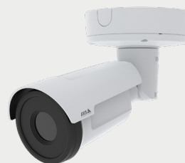
AXIS Q1961-TE Thermal Camera

Questa telecamera termometrica priva di alogeni consente di monitorare da remoto le temperature e attivare eventi basati sulla temperatura. È ideale per aumentare l'efficienza operativa. Robusta e resistente agli urti, offre analitiche di rilevamento precoce degli incendi e funzionalità di cybersecurity integrate.