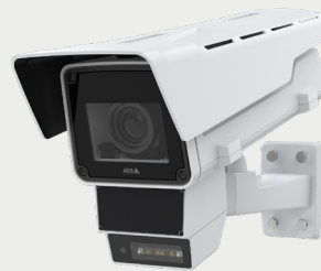
Axis Radar-fusion Camera

Protezione dalle intrusioni su vaste aree e rilevamento affidabile 24 ore su 24 e 7 giorni su 7 grazie alla fusione di due potenti tecnologie: il video e il radar. Questo dispositivo unico nel suo genere offre una classificazione degli oggetti all'avanguardia basata sul deep learning, per un rilevamento e una visualizzazione di livello superiore.